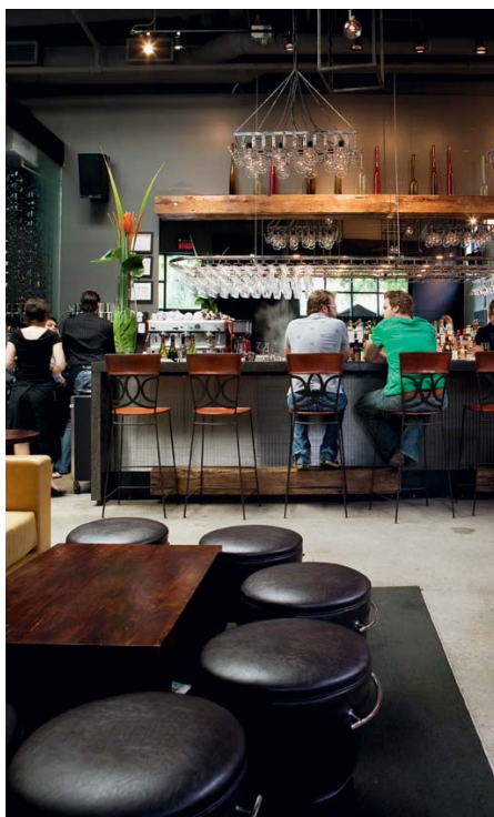
Un classique: après 15 ans, le Toqué! ne montre pas le moindre signe d'essoufflement.