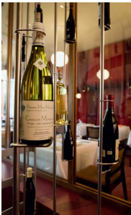
Nouveau: Le Local en bordure de la vieille ville.

sique indie et musique expérimentale y sont très vivantes. Les bonnes adresses pour écouter les talents internationaux et locaux sont la Casa del Popolo et, juste en face, la Sala Rossa. De jour, la Casa est un café confortable. Dans la Sala Rossa, des DJ inventifs assurent aussi une folle ambiance le week-end avec leurs beats déjantés.